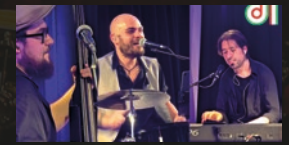
Amici di Musica · 19.00 Uhr

„Kleesattels Esszimmer“ Kölner Straße 46