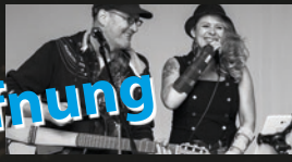
SchoHnzeit · 18.30 Uhr