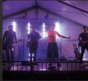
69 Shotz 17.00 Uhr