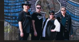
Spage Age Dream · 18.00 Uhr