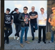
Guns n' Poses 20.45 Uhr