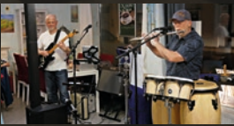
2M · 16.00 Uhr

„Tendur Restaurant“ Flach-Fengler-Straße 78-80