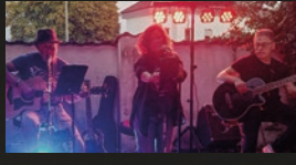
Hat and Voice · 12.00 Uhr