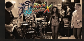
TheRockClassiX · 20.00 Uhr