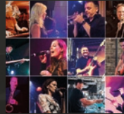
SoulCake 18.45 Uhr