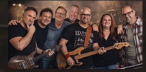
Yeah! · 20.15 Uhr