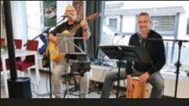
Green Shoe · 15.00 Uhr