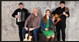
Celtic Fire · 16.00 Uhr