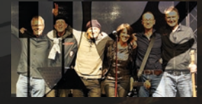
Marsbeat · 20.00 Uhr