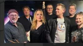
Blind Summit · 18.00 Uhr