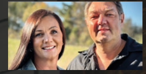
Tonspende · 20.15 Uhr