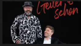
Geiler is' schon · 21.00 Uhr