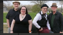
Appetite for Acoustic · 18.00 Uhr