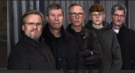
ToMess · 18.30 Uhr