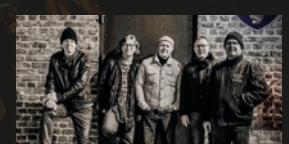
Rail Station · 19.00 Uhr